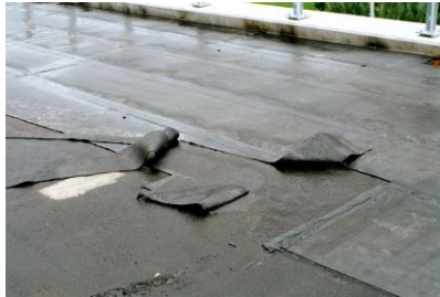
Abbildung 1: PBD-Abdichtung mit sehr schwachem Verbund. Direkt nach dem Auflämmen war der Verbund gut, am nächsten Tag jedoch völlig ungenügend.

Die Dicke solcher Karbonatschichten beträgt bis etwa 0,01 mm (10 Mikrometer). Die Karbonatschicht verschliesst die Betonoberfläche kompakt, sie verhindert dadurch das Verankern von Folgeschichten (Grundierungen auf Bitumenbasis, Grundierungen auf Epoxidbasis, PBD-Abdichtungen).